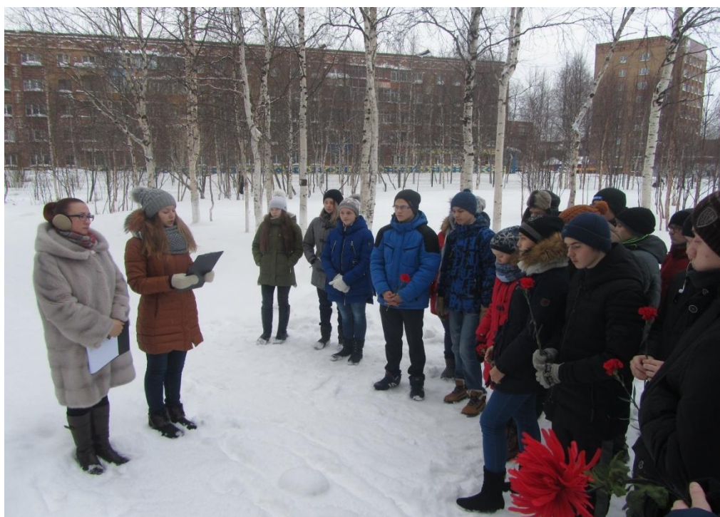
Учащиеся 8 классов МБОУ «Гимназия № 2» на торжественном митинге, посвященном россиянам, исполнившим служебный долг за пределами Отечества.